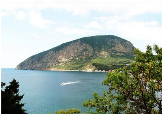
МЕДВЕДЬ ГОРА (АЮ-ДАГ)