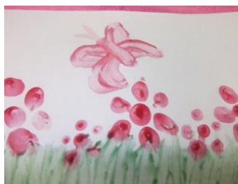
Рисунок «Мишутка» я нарисовал красками на основе кофейного отвара. Рисунок «Цветочная поляна» – красками на основе крахмала и свекольного сока.